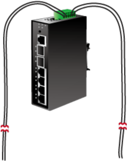
DC/DC Power Failure