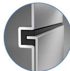
Sealed Lock-and-Key Design

Na zadní straně je k dispozici celá řada portů, mezi nimiž vyčnívá především rozhraní HDMI 2.0 , které zajistí snadné promítání 4K obsahu při vyšším jasu a kontrastu oproti standardnímu rozlišení. Jas je klíčem k viditelnosti. I proto nabízí projektor BenQ LU9245 funkci dynamického tlumení jasu dle scény a optimalizuje světelný výkon a kontrast pro co nejlepší obraz.