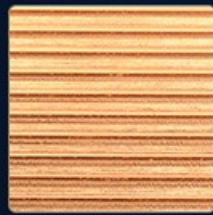
Efficient heat sink