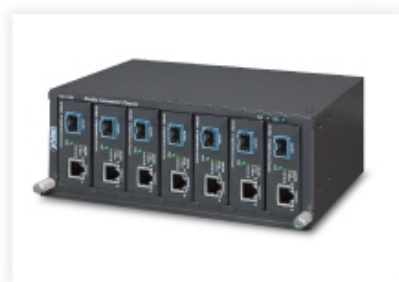
Media Chassis Installation