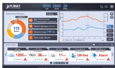
User-friendly Dashboard Design

Je vybaven centralizovaným inteligentním rozhraním pro správu, které je navrženo tak, aby bylo intuitivní a uživatelsky přívětivé. Toto rozhraní poskytuje komplexní ovládací panel, který nabízí monitorování a správu všech připojených zařízení IoT v reálném čase. Díky přehledným vizualizacím a snadno ovladatelným nabídkám mohou uživatelé rychle přistupovat k důležitým informacím, analyzovat data a přijímat informovaná rozhodnutí.