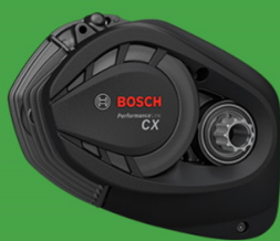
PERFORMANCE LINE CX

S Lil'Buddy s Active Line nelze udělat chybu! Je to ten správný motor pro každého, kdo klade velký důraz na elegantní vzhled a pocit z hladké jízdy. Bez rušivých vnějších zvuků získáte jemnou podporu až do rychlosti 25 km/h. A každý, kdo chce jet rychleji, bude těžit z minimálního odporu pedálů.