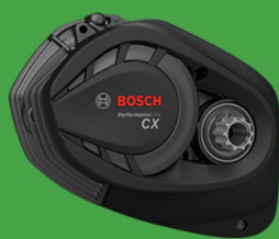
PERFORMANCE LINE CX

S Lil'Buddy s Active Line nelze udělat chybu! Je to ten správný motor pro každého, kdo klade velký důraz na elegantní vzhled a pocit z hladké jízdy. Bez rušivých vnějších zvuků získáte jemnou podporu až do rychlosti 25 km/h. A každý, kdo chce jet rychleji, bude těžit z minimálního odporu pedálů.